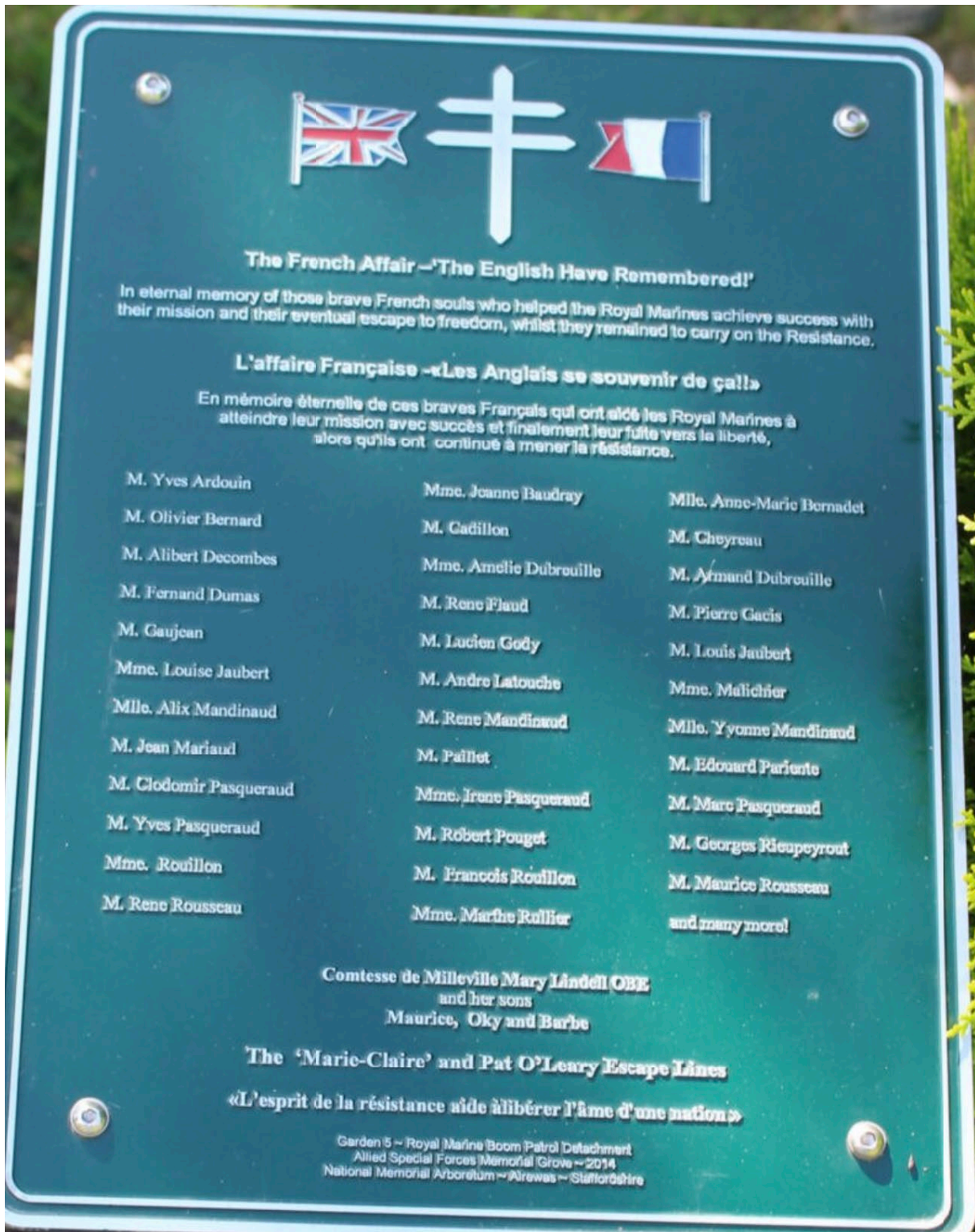
Abbildung 2 – Gedenkplakette in der Allied Special Forces Association Grove in Alrewas, Staffordshire