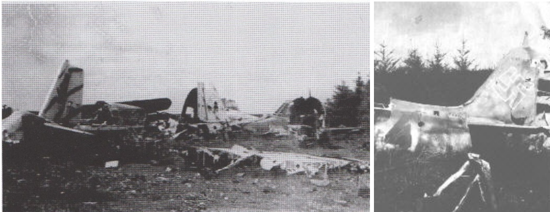
Fotos der Zerstörungen auf dem Flugplatzgelände in Moorkaten mit gesprengten Trümmern von zwei Ju 388 L (links) und einer FW F-3.

Die Teilkapitulation der Wehrmacht ermöglichte den Briten am 5. Mai 1945 die sofortige Besitznahme der deutschen Flugplätze in Schleswig-Holstein, um dort Material und Dokumente vor ihrer Zerstörung durch die Deutschen zu sichern. Das besondere Augenmerk galt hierbei den modernen Düsenflugzeugen der Luftwaffe. Soldaten vom „2819 Light Anti-Aircraft Squadron“, Bodentruppen des Royal Air Force Regiments, besetzten das Flugfeld Kaltenkirchen-Moorkaten kampflos und ohne Blutvergießen. Das Kommando über die etwa 30 bis 40 Mann starke Spezialeinheit mit ihren sechs Fahrzeugen hatte Flight Lieutenant Richard George Fisher. Die Deutschen waren schneller gewesen und hatten vor ihrer Flucht alles noch verwertbare militärische Gerät und die technische Ausrüstung mitgenommen oder zerstört und das Flugplatzgelände vermint – Taktik der verbrannten Erde auch in Moorkaten. Die von den Briten vorgefundenen 25 bis 30 Maschinen waren nur noch Schrott.